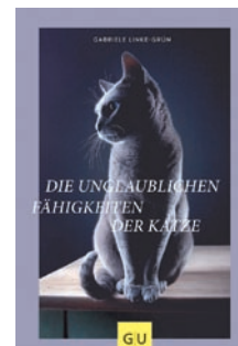
Die unglaublichen Fähigkeiten der Katze Gabriele Linke-Grün

Experten analysieren die einzelnen Geschichten und erklären das Verhalten auf Basis neuer Forschungsergebnisse. Dabei geht es nicht darum, der Katze die Mystik zu nehmen, sondern mit vielen Vorurteilen aufzuräumen und durch Erkenntnisse, zum Beispiel, bei der Krankheitserkennung, Katzen-Verhalten besser zu deuten. Zwischendurch trifft der Leser auf wunderbare lyrische Zitate. In dem Hardcover-Buch findet der Leser aber auch einen Mythen-Check, in dem „Volksmeinungen“ gegenüber Katzen unter die Lupe genommen und daraus Schlüsse fürs Zusammenleben gezogen werden. Zusätzlich gibt es Informationen rund um das Wesen und die Fähigkeit der Miezchen.